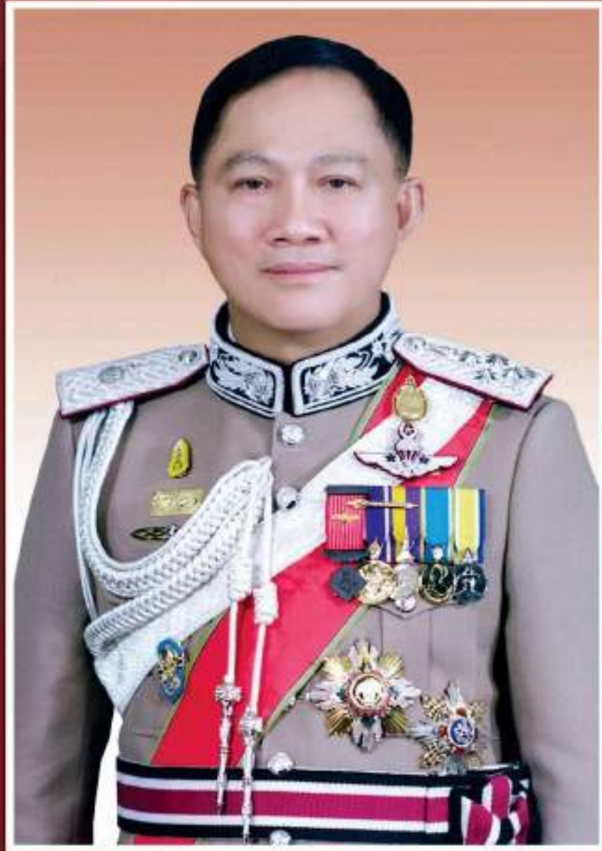
พลตำรวจเอก อุดลย์ แสงสิงแก้ว ผู้บัญชาการตำรวจแห่งชาติ